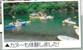
▲カヌーも体験しました!