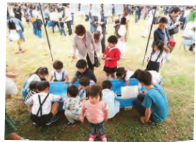
▲鏡川緑地公園いっしょの 子どもたち

今年も鏡川の生態コーナーやごみ収 集車見学などの環境コーナーをはじめ 防災コーナーのほか、ダンスや地元 歌手のライブなどステージイベントを 開催。3日の夜は、美しい秋空に満開の 花火が打ち上げられ、多くの来場者を 喜ばせました。