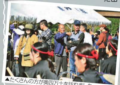
▲たくさんの方が奥四万十を訪れました