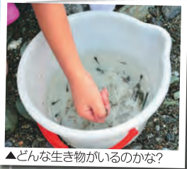
▲どんな生き物がいるのかな?