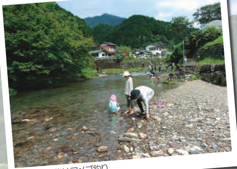
▲頑張った後はアメゴ釣り