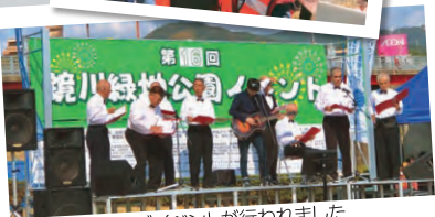
▲様々なステージイベントが行われました