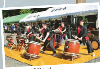
▲西土佐みのり太鼓

四万十市内から四万十川 上流へ車で約1時間。四万十 の奥の奥、黒尊の自然を満 喫できる「しまんと黒尊むら まつり」が11月9日(土)、黒尊 親水公園で開催されました。 今年は紅葉が遅く青々とした 山々に囲まれ、すがすがし い気候の中多くの方が訪れ、マイ箸やリ ース作りなどの教室、鹿 肉の串焼きや焼き鳥 など地元食材を使った 黒尊グルメ、もみじ狩 りツアーなど、奥四万十 の自然を満喫 しました。